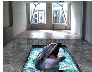
Рис. 7.2. Приклади наливних декоративних підлог 3D

Фахівцями компанії підраховано, що вартість на наливні 3D підлоги складе понад 1600 грн/м 2 , залежно від складності малюнка й основи підлог.